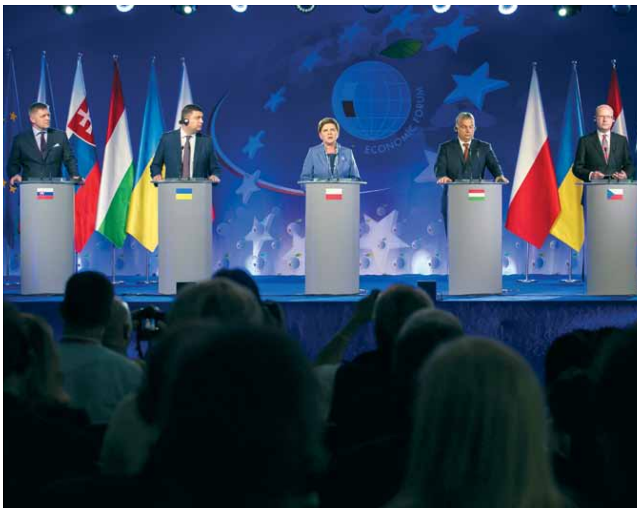
Robert Fico, Premier Słowacji; Wołodymyr Hrojsman, Premier Ukrainy; Beata Szydło, Prezes Rady Ministrów, Polska; Viktor Orbán, Premier Węgier; Bohuslav Sobotka, Premier Czech

Forum Ekonomiczne od ponad 25 lat jest największym i najważniejszym spotkaniem liderów świata polityki i biznesu w Europie Środkowo-Wschodniej.