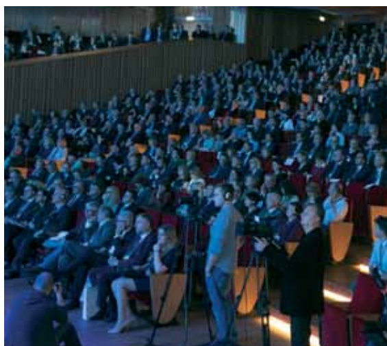
Goście Europejskiego Kongresu Samorządów