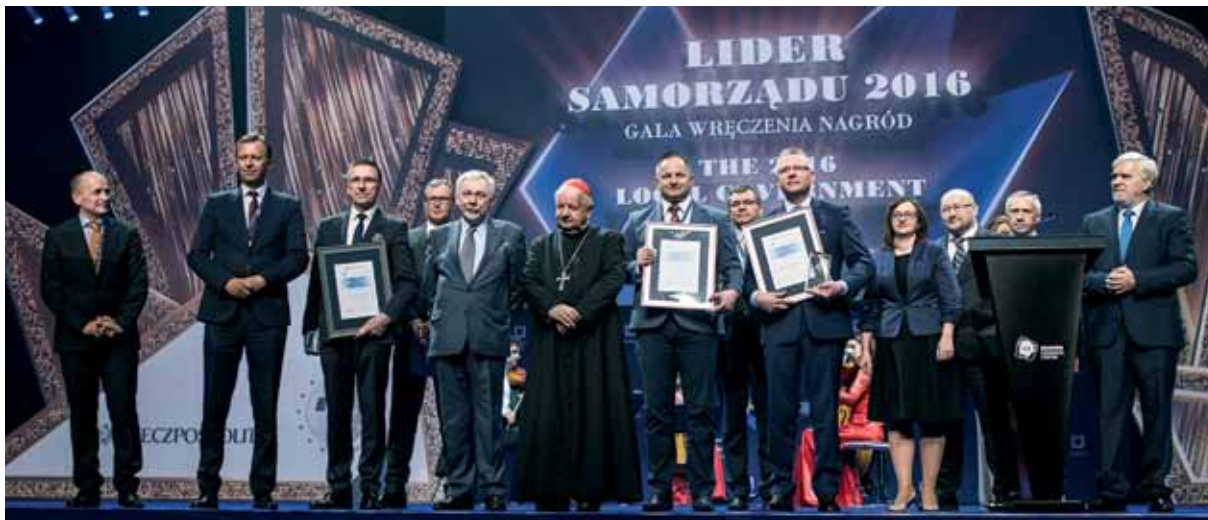
Laureaci Konkursu „Lider Samorządu 2016”