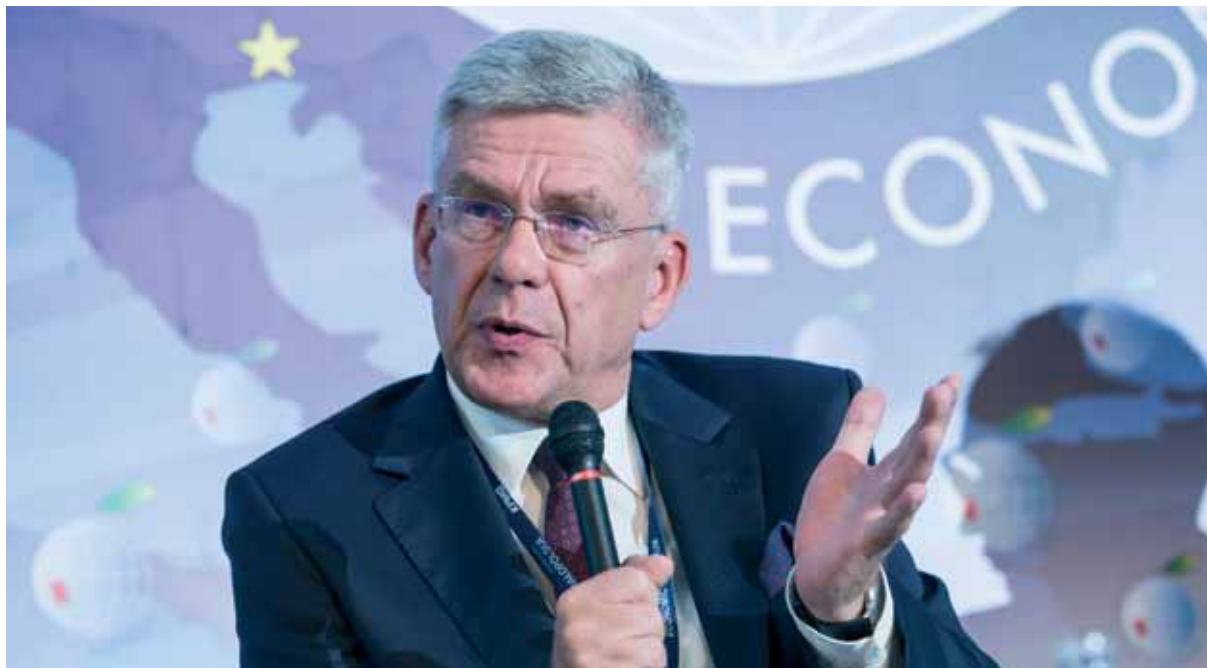
Stanisław Karczewski, Marszałek Senatu Rzeczypospolitej Polskiej