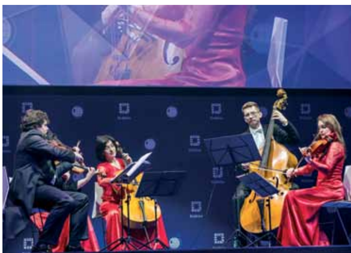
Gala Lider Samorządu