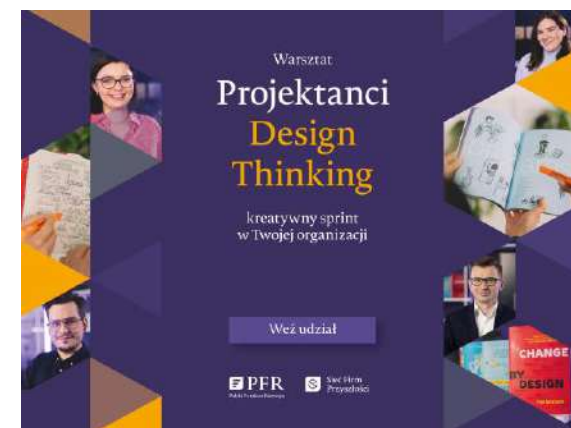
Warsztaty dla organizacji