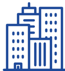
BIURA HOTELE APARTAMENTY